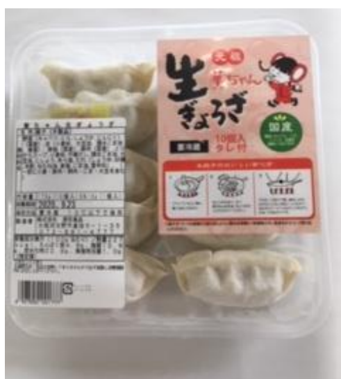
【対象商品の表面写真】